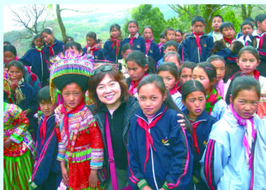
去年4月到雲南講學，與當地學生留影

她說，現代社會將種種家庭問題帶進校園去，面對愈來愈複雜的課題如濫藥、欺凌、上網成癮等，加上教育普及後，學生個別差異擴大，如果只顧教好一節課，就是連教師也過不了自己。在繁重的教學工作中不忘關心學生，是我們仍然相信的天賦使命。關愛難以量度，但教師的努