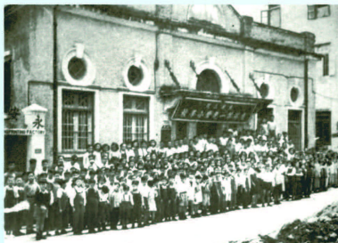
首間「文武廟義學」建於1880年，1946年改建為「東華三院第一免費小學校」，1973年命名為「東華三院李西晴紀念小學」

也要求年青人具備大學程度。然而，大學收生一直鎖死於18%，前特首董建華提出副學位作為出路，東華三院也乘勢於2005年與中大合辦社區書院。追求高學歷既是大勢所趨，不少大專和教育團體對私立大學都躍躍欲試，東華的社區書院可有此計劃？韓孝述笑說「講就容易」，最大問題是師資，其次是財政壓力，加上學費昂貴，除政府資助外，校方也要提供大量獎學金。不過，既然有需求，校方也期望將來可以提供學位課程。