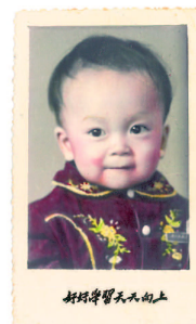
童年時候的蔡若蓮

為甚麼要辦優秀教師選舉？蔡若蓮說是要探索「教師」如何從職業走向專業，在追求科學與藝術並重的過程中，滙聚業界智慧，找出有效的辦法、心得和點子，提升教學效能，共同面對社會的轉變。