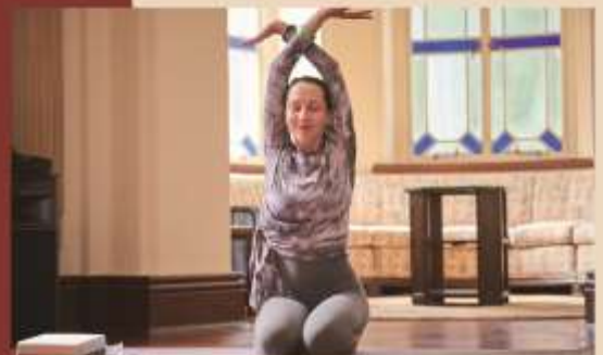
Integrated Music & Wellness Programme 音樂與心靈支援