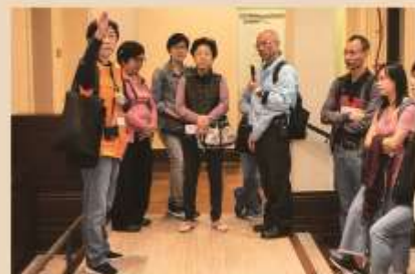
Cultural and Heritage Guided Tours 歷史文化導賞團

Address: 15A Tai Hang Road, Tai Hang, Hong Kong 地址：香港大坑大坑道15號A