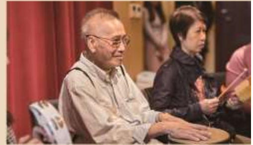
Social & Community Outreach Programmes 社區共融及外展計劃