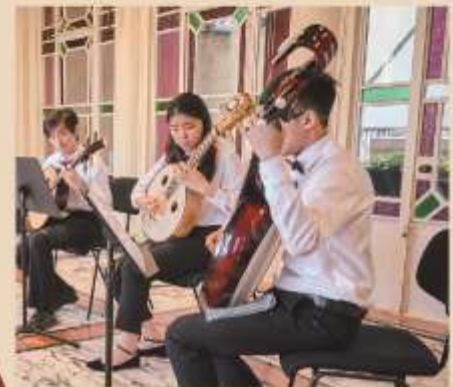
Instrumental and Ensemble Classes for Chinese and Western Music 中西常規樂器課程和室樂小組