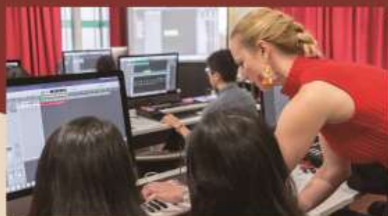
Innovation & Creativity @Haw Par Music Lab 音樂與靈感創作@虎豹音樂創作室