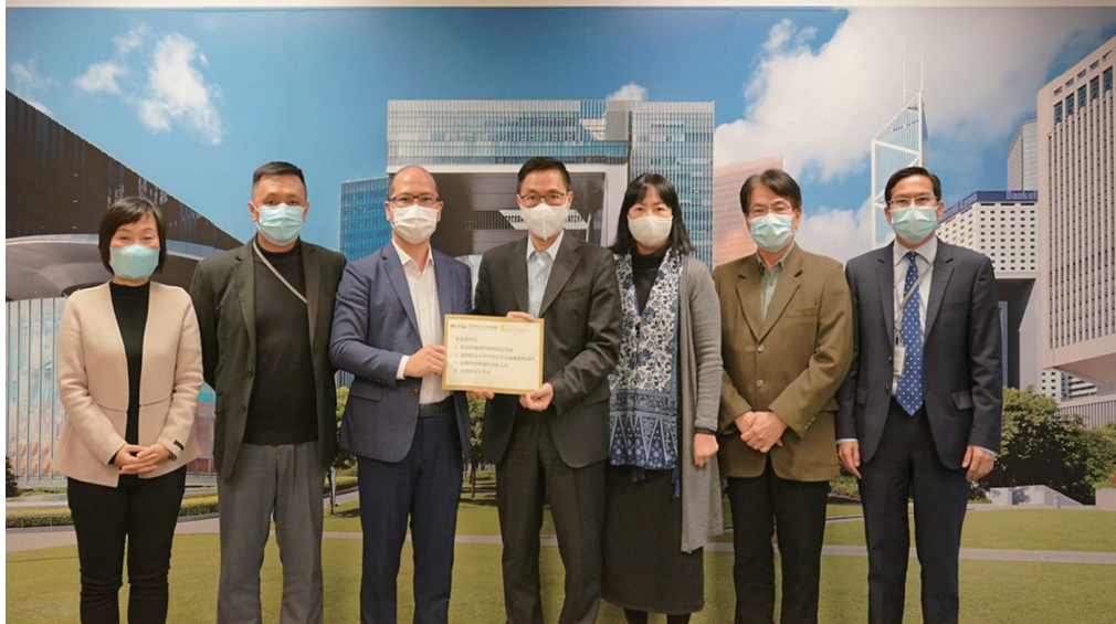
左起：教育局副局長蔡若蓮、立法會議員鄧飛、教聯會主席黃錦良、教育局局長楊潤雄、教育局常任秘書長李美嫦、教聯會會長黃均瑜、立法會議員朱國強