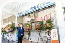
將軍澳辦事處正式啟用